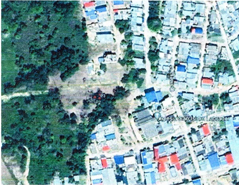
Ilustración 1: Imagen Satelital de árboles a aprovechar

Teniendo en cuenta que el objeto del aprovechamiento no es comercial y se realiza para reclamar el derecho de obras públicas o privada y que de las tres clases de aprovechamiento forestal (árboles aislados, único y persistente) contempladas en el decreto 1076 del 2015 contempladas en el título 2 biodiversidad capítulo 1 flora silvestre, en la sección 6, del aprovechamiento forestal doméstico, ARTÍCULO 2.2.1.1.6.2. Dominio público o privado. Para realizar aprovechamientos forestales domésticos de bosques naturales ubicados en terrenos de dominio público o privado, el interesado debe presentar solicitud formal a la Corporación. En este último caso se debe acreditar la propiedad del terreno.